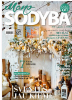
Mano sodyba Nr. 12, 2019