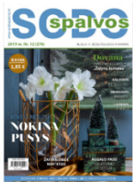
Sodo spalvos Nr. 12, 2019