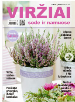
Augalų pasaulis Nr. 86, 2019