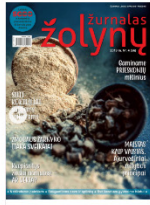
Žolynų žurnalas Nr. 4 (56), 2019